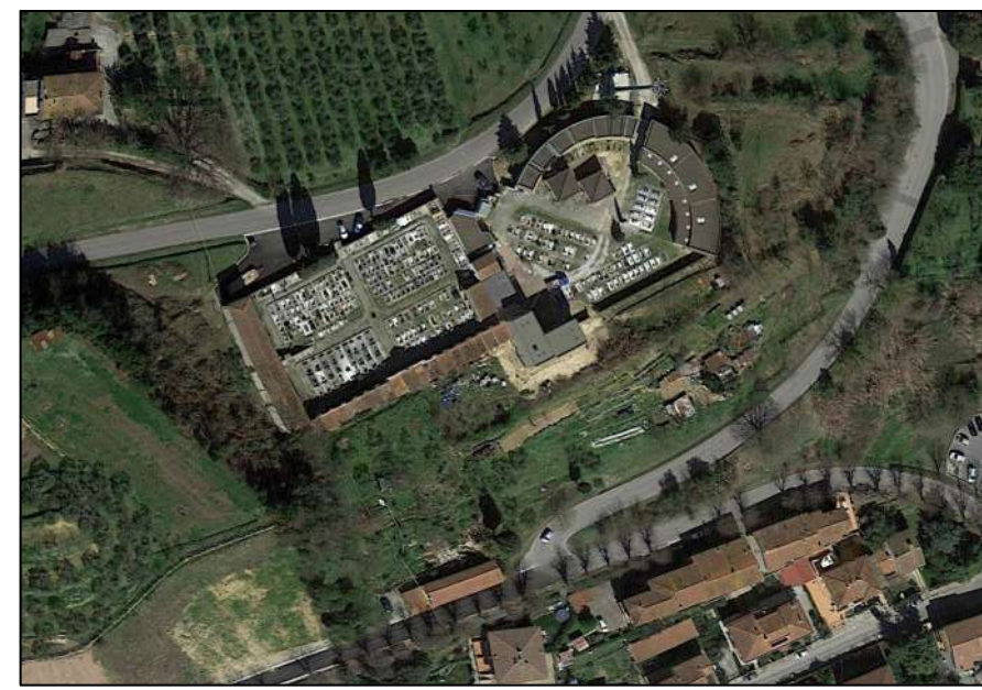
TAVOLA n° A07